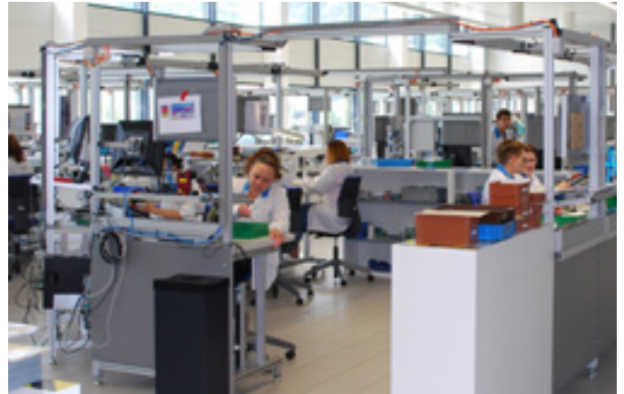
MPS Microsystems: un bâtiment ultra-moderne au service de produits d'une grande complexité.

Im 2008 errichteten Gebäude mit einer Fläche von über 14'000 m 2 sind die Forschungs- und Entwicklungsabteilung mit sechs Entwicklungsingenieuren und zwei Labortechnikern, eine Abteilung für die Industrialisierung, ein Raum für die Montage von Mikrosystemen (1000 m 2 garantiert staubfrei und ein Reinraum der ISO 7-Klasse mit einer Fläche von 2'000 m 2 ), eine Abteilung für Qualitätskontrolle und -sicherung, Einrichtungen für Wärme- und Oberflächenbehandlung, sowie eine große Dreh-, Fräs-, Elektroerosions- und Schleifwerkstatt untergebracht. Insgesamt sind in dieser Werkstatt 76 CNC- und 77 kurvengesteuerte Maschinen aufgestellt. Die Drehvorgänge (auf Tornos-, Schaublin-, Index- und Mazak-Maschinen je nach Durchmesser), Fräs- und Elektroerosionsvorgänge werden an Stangen mit Durchmessern von 2 bis 42 mm mit Toleranzen von +/- 3 µm durchgeführt. Bei den Innen- und Außenschleifvorgängen sind Toleranzen von +/- 0,5 µm möglich, während bei den Poliervorgängen hinsichtlich Rauheit Ergebnisse unter 10 nm erzielt werden. Die Abteilung für Oberflächen- und Wärmebehandlung ist für Härteprozesse, Ausscheidungshärten,