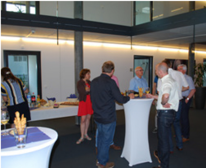
Derniers échanges à l'issue de deux jours très instructifs.